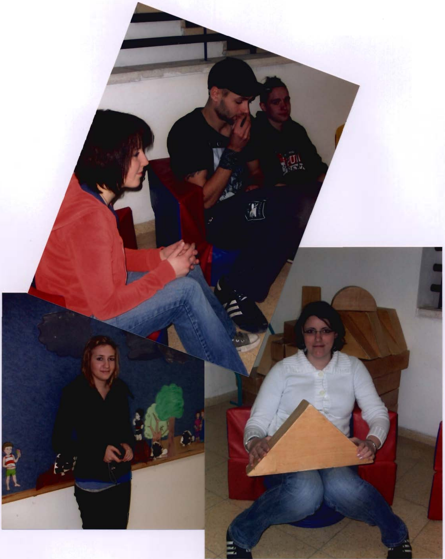
Eindrücke vom Integrativen Kindergarten Jerusalem