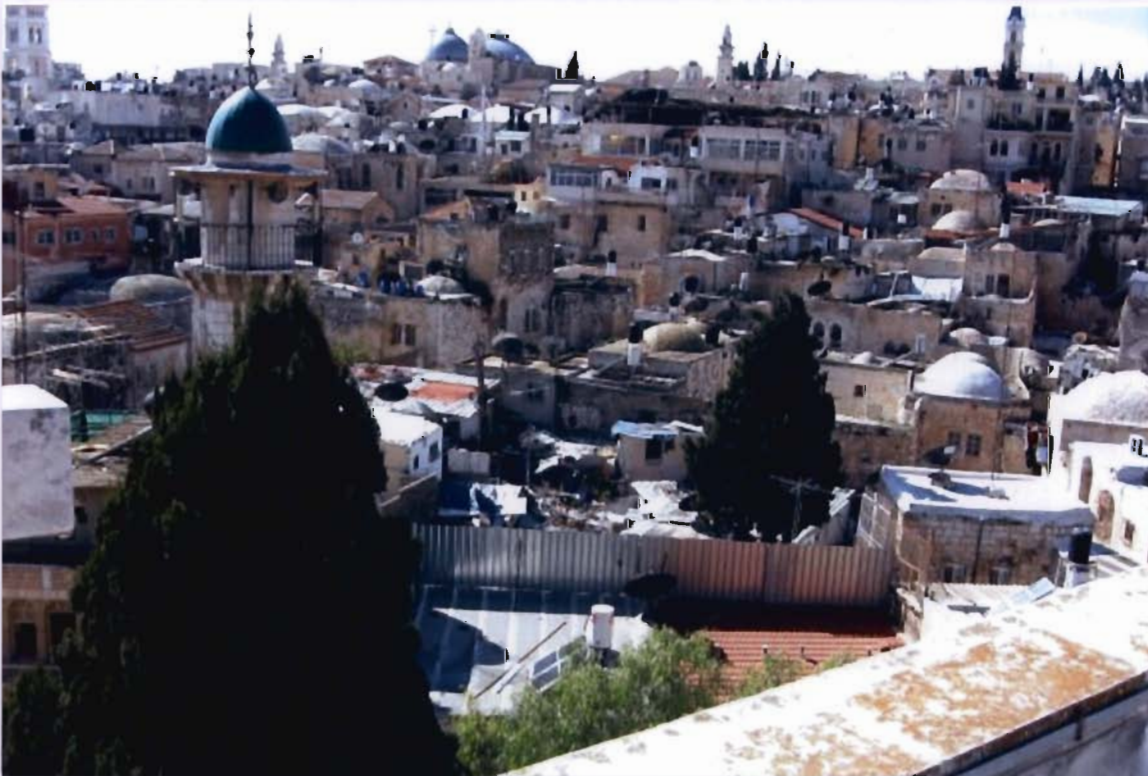
So auch in Jerusalem: unterschiedlich farbige Wassertanks zeugen vom Glauben ihrer Hausbewohner

Kontaktpersonen, die wir zu anderen Aspekten hätten ansprechen können, waren zu dem Zeitpunkt unerreichbar und eine Wartezeit von über 2 Stunden fanden wir aufgrund unseres kurzen Aufenthaltes in der Stadt für nicht angemessen. Der Gegenbesuch birgt eventuell die Chance, sich weiterhin zu informieren?!