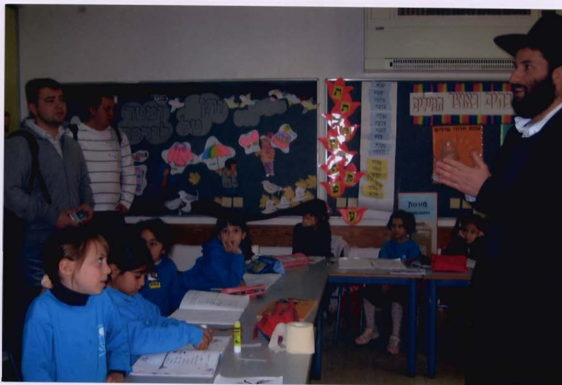
first grade class: girls during writing lesson

I Unfortunately nobody told us before. So we had to leave the school